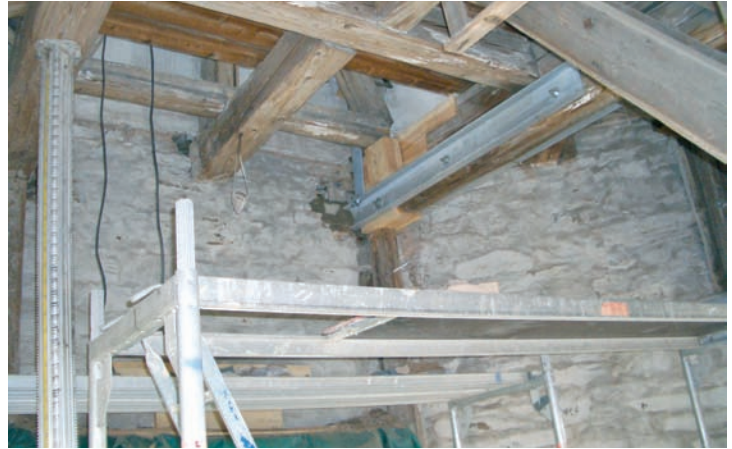
Weitere Bilder in einer kleinen Ausstellung in der Kirchenvorhalle.

ferblechgedeckten hölzernen Turmspitze in das Mauerwerk. Hier müssen alle 18 Balkensauflager einschließlich der Verankerung mit den nach oben laufenden Holzbalken durch verzinkte Stahlbauteile ersetzt werden. Nach Auskunft des bauausführenden Zimmermeisters Kluge sollen diese Arbeiten im September abgeschlossen werden. Den überwiegenden Teil der anfallenden Kosten muss die Kirchgemeinde durch Spenden finanzieren. 20.000 Euro sind dafür schon eingegangen, wofür wir herzlich danken. Mindestens der gleiche Betrag wird noch erforderlich sein, um die Rechnungen bezahlen zu können. Wolfram Menzer