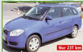
Skoda Fabia Combi AMBIENTE EZ 07/08, 51kW, 23.150 km, dynamicblau, ZV mit FB, Klima, el. FH, ABS, ASR, Servo, Tempomat, Euro4, CD-Radio Dance, Bordcomputer, Dachreling, Garantie 7.990,- €