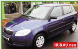
Skoda Fabia Cool Edition EZ 10/09, 44 kW, 36.049 km, stornblau-metallic, ZV, Klima Climatic, Servo, ABS, Bremsassistent, el. FH, CD-Radio Dance, Euro 4, HU&AU neu, Garantie 7.390,- €