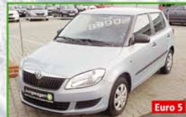
Skoda Fabia Cool Edition EZ 03/11, 44 kW, 14.740 km, aquablau-metallic, ZV mit FB und Safe Funktion, Servo, Klima, Pollenfilter, el. FH, ABS, ASR, ESP, CD Radio SWING, Euro 5, Garantie 8.990,- €