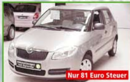
Skoda Fabia Cool Edition EZ 12/08, 44 kW, 30.650 km, cappuccino-beigemetallic, ZV mit Safe System, el. FH, Servo, Klima, Pollenfilter, ABS, Wegfahrsperr, CD Radio Dance MP3-fähig, Garantie 7.690,- €