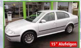
Skoda Octavia 1.6 TOUR EZ 06/08, 75 kW, 39.170 km, brillantsilber-metallic, ZV mit FB, Klima, Pollenfilter, el. FH, Servo, ABS, ASR, CD Radio, Euro 4, Garantie, 15-Zoll-Alufelgen 8.790,- €