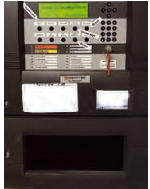
Grundschule Hauptstraße Aufschaltung der Brandmeldeanlage auf die integrierte Leitstelle