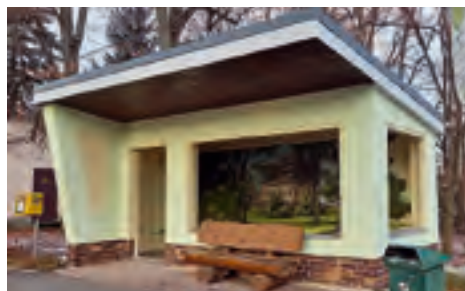
Buswarte „Haltestelle am Teich“ Dorfstadt Sanierung über Förderprogramm LEADER-Kleinprojektförderung