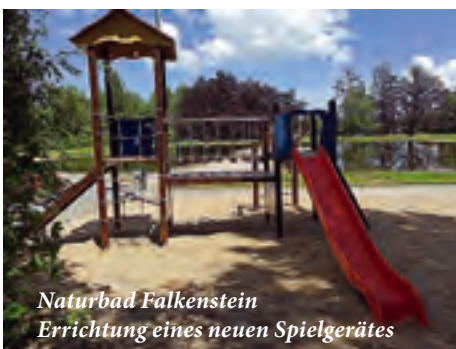
Naturbad Falkenstein Errichtung eines neuen Spielgerätes