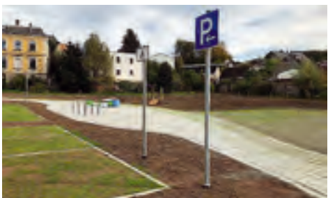
Ortszentrum Oberlauterbach Neugestaltung und Aufwertung der Freifläche am ehem. Gasthof Goldener Hirsch über Förderprogramm – Vitale Dorfkerne und Ortszentren im ländlichen Raum