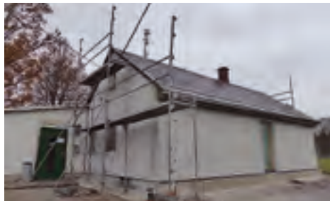
Vereinsheim TSV Trieb e.V. Abbruch eines nicht mehr genutzten Anbaus über Förderrichtlinie LEADER (RL-LEADER/2014)