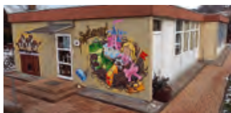
Kindertagesstätte Spatzennest Trieb Fassadenreparatur und Graffitigestaltung über Förderprogramm LEADER-Kleinprojektförderung