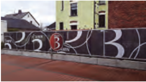
Begegnungszentrum Vitamin B Errichtung eines Sichtschutzes auf der Terrasse