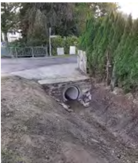
Durchlass „Am Schafacker“ Instandsetzung