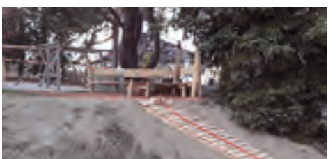
Grundschule Dorfstadt Neugestaltung Vorplatz und Freianlagen über Förderrichtlinie Ländliche Entwicklung (RL LE/2014)