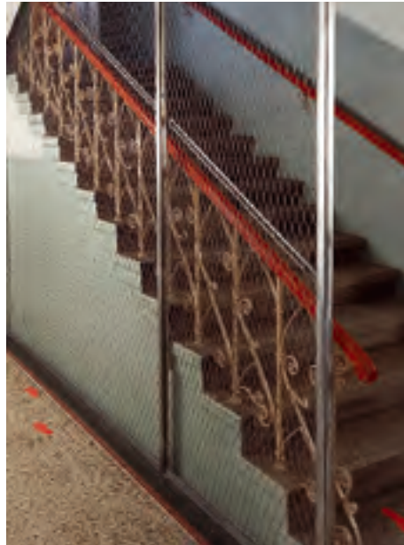
Grundschule Dorfstadt Umsetzung von bauaufsichtlichen Forderungen, z.B. Errichtung einer Absturzsicherung der Treppe