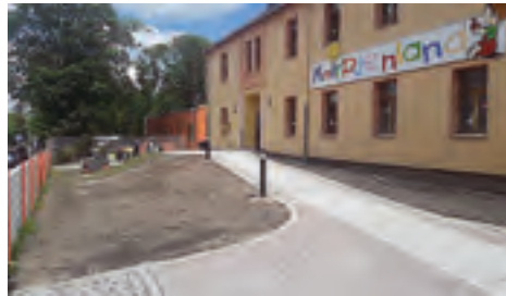
Kindertagesstätte Knirpsenland Fertigstellung Umbau Haupthaus und Ertüchtigung Brandschutz über Förderprogramm – VwV Kita Bau