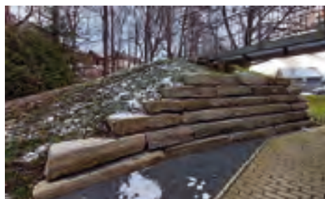
Senioren- und Jugendhaus Ortsteil Trieb Ersatzneubau einer Stützwand über Förderprogramm LEADER-Kleinprojektförderung