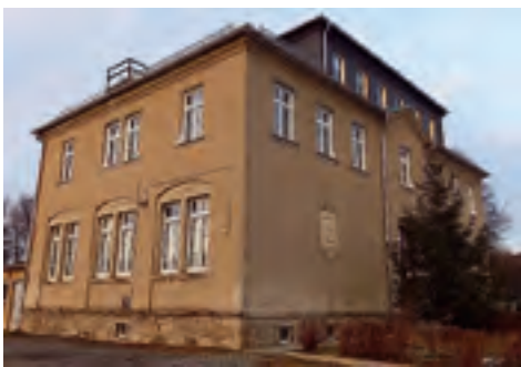
Dorfstuben im Ortsteil Trieb Erneuerung von Fenstern über Förderprogramm LEADER-Kleinprojektförderung