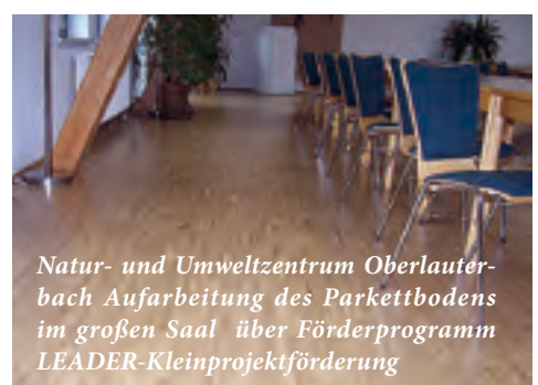
Natur- und Umweltzentrum Oberlauterbach Aufarbeitung des Parkettbodens im großen Saal über Förderprogramm LEADER-Kleinprojektförderung