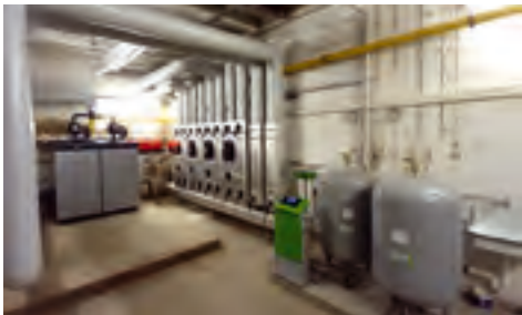
Grundschule Hauptstraße Erneuerung der Wärmeerzeugungsanlage über Förderprogramm EFRE – Schulinfra