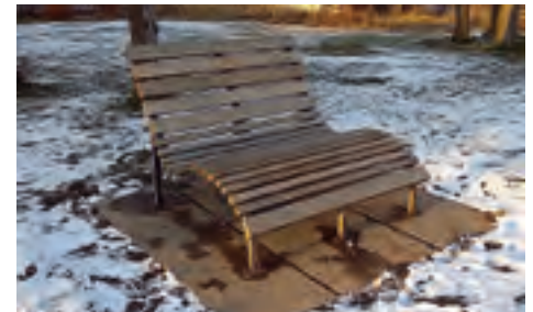
Stadtpark Errichtung der Erlebnisinsel des Mittelzentralen Städteverbundes Göltzschtal