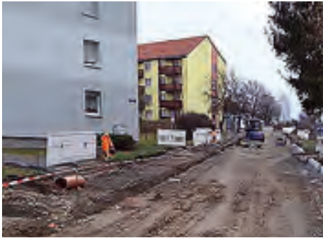
Paul-Popp-Strasse Grundhafter Ausbau über Förderprogramm RL KStB Teil A