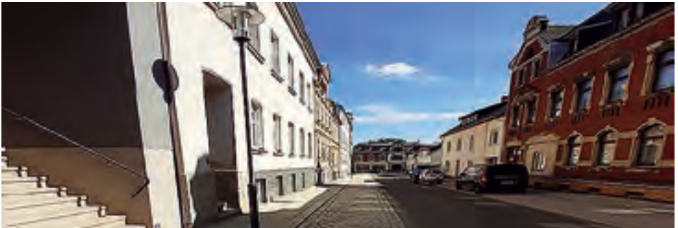
Feldstraße Grundhafter Ausbau 2. BA über Förderprogramm Stadtumbau Ost