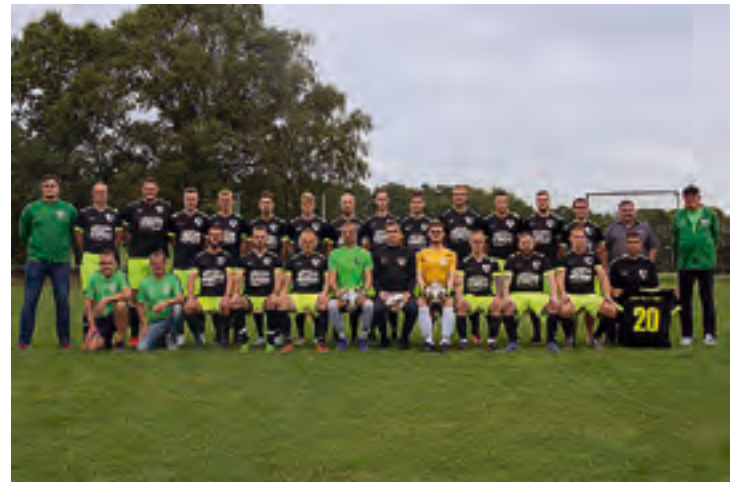
Die 1.Mannschaft des TSV Trieb 1887 bedankt sich bei der Firma „Heckel-Fenster GmbH“ aus Trieb für die neuen Trikots und die langjährige finanzielle Unterstützung