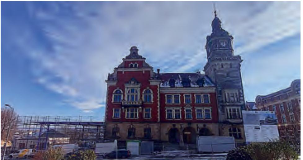
Rathaus Falkenstein Sanierung und Umbau inkl. Ergänzungsneubau mit Touristeninformation über Förderprogramm Kleine Städte und Gemeinden - KSP