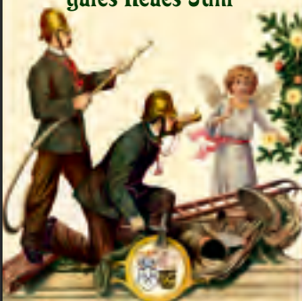
Aber Obacht mit den Kerzen, sonst muss die Feuerwehr anrücken!

Kein Blümchen blüht im Garten mehr, das unser Herz erfreuet; verstummt ist längst der Vögel Heer, das Feld ringsum beschneiet. Doch bringt der raue Wintersmann Auch manche schöne Freude, und wer es nur erwarten kann dem brennt ein Bäumchen heute! So mag's denn draussen frieren, schnei'n, im Stübchen hier ist Frieden, und reiche Gaben, groß und klein, hat Liebe mir beschieden. Drum klopft vor Freude mir das Herz Und dank für eure Liebe, entfernt von euch sei jeder Schmerz und euer Blick nie trübe. Und tat ich oft mit leichtem Sinn Nicht immer, was ich sollte, so nehmt den guten Willen hin, der euch nie kränken wollte. (Ernst Anschütz, 1780 – 1861)