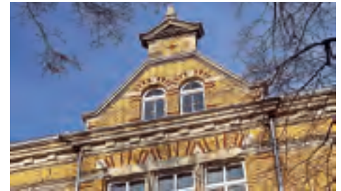
Oberschule W.-Adolf-von-Trützschler Sanierung der Ziergiebel