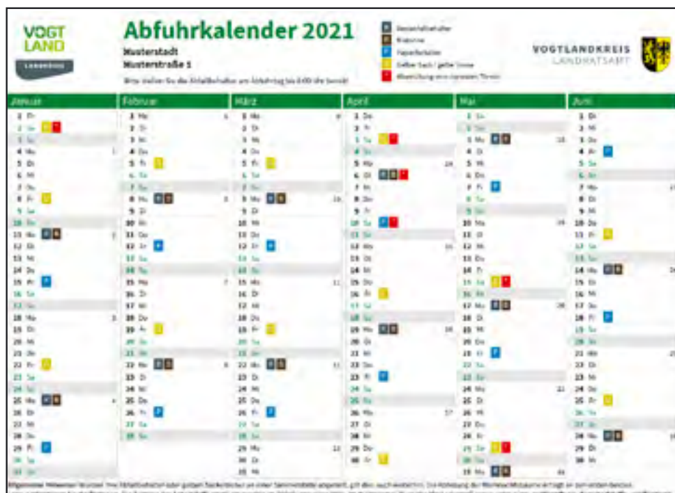
Beispiel des beidseitig bedruckten Abfuhrkalenders Januar bis Dezember 2021, Grafik: Landratsamt

Mo, Di, Do, Fr 8:00 – 16:00 Uhr Mi 8:00 – 12:00 Uhr Sa (gerade Kalenderwoche) 8:00 – 12:00 Uhr