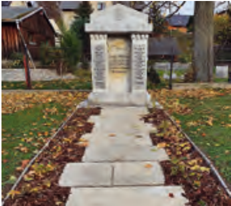
Denkmal für die Gefallenen des 1. Weltkrieges Oberlauterbach Sanierung des Gedenksteines und des Umfeldes über Förderprogramm LEADER-Kleinprojektförderung