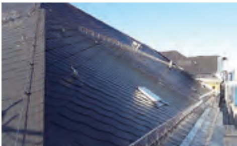
Oberschule W.-Adolf-von-Trützschler Erneuerung der Dacheindeckung inkl. Blitzschutz über Förderung Schulische Infrastruktur